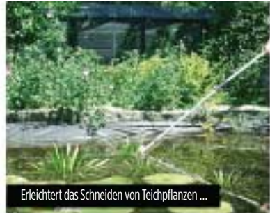
Erleichtert das Schneiden von Teichpflanzen ...