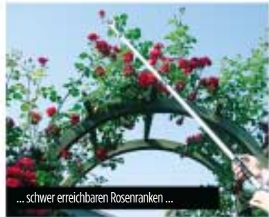
... schwer erreichbaren Rosenranken ...