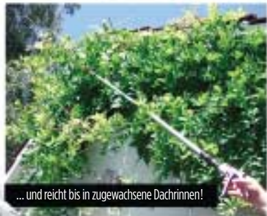
... und reicht bis in zugewachsene Dachrinnen!