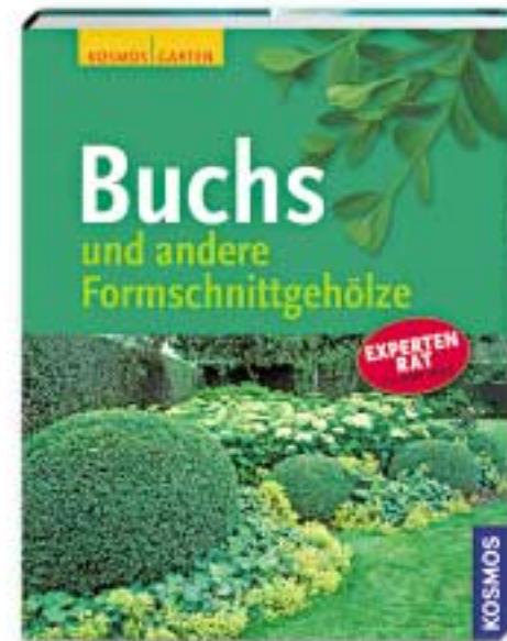
3 Set: Buch + Buchs-Schere

Nr. 087016 € 49,90 Anzahlung € 4,90 und 4 Raten zu je € 11,25; gesamt € 49,90.