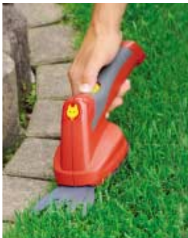
Handlich und sicher: So gehen Schneidearbeiten leicht von der Hand und die Zweiknopf-Bedienung verhindert Verletzungen.