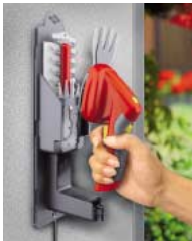
Gut verstaut: Die stabile Wandhalterung bietet Platz für die Schere, die Scherenblätter sowie das Ladegerät.