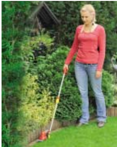
So schonen Sie Ihren Rücken: Dank der Teleskopstange schneiden Sie auch am Boden mühelos, z.B. Rasenkanten.